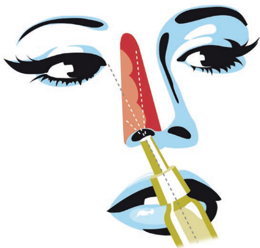
Rycina 2. Prawidłowa aplikacja leku donosowego w aerozolu.

W przypadku preparatu o wysokim wskaźniku tiksotropii należy pamiętać, aby przed jego podaniem przez 10 s intensywnie wstrząsać lekiem (do zmiany żelu w zol).