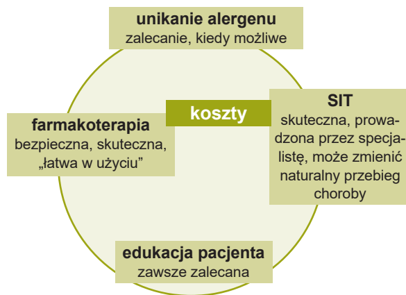
Rycina 1. Podstawowe zasady leczenia ANN wg ARIA.

Na rycinie 2 przedstawiono prosty schemat leczenia alergicznego zapalenia błony śluzowej nosa u dzieci, a w tabeli 2 zebrano podstawowe grupy leków, które znalazły zastosowanie w terapii ANN, z uwzględnieniem ich wpływu na poszczególne objawy.