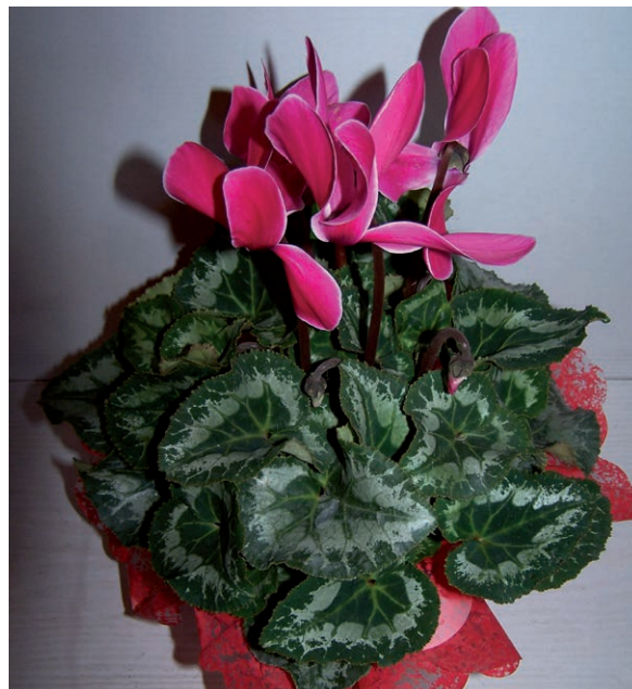
Rycina 4. Cyklamen perski ( Cyclamen persicum ).

zawartość saponin oraz trującego glikozydu cyklaminy. Objawy zatrucia to: nudności, wymioty, bóle żołądka, biegunka, skurcze, paraliż oddechowy. Sok z bulw działa drażniąco na skórę [6, 7].