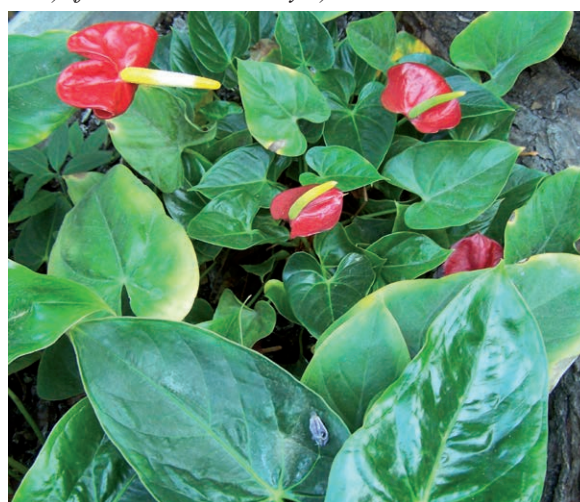
Rycina 1. Anturium Andreego (Anthurium andreaeanum).