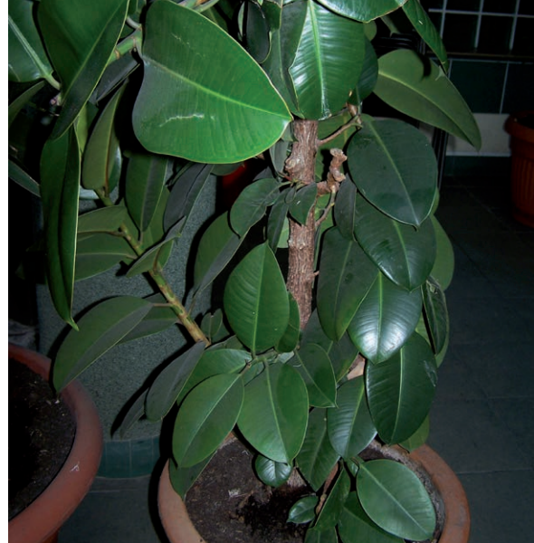
Rycina 7. Figowiec sprężysty ( Ficus elastica ).

Rośliny wytwarzają całobrzegie, skórzaste liście ułożone na łodydze skrętolegle (ryc. 7). Sok mleczny występujący we wszystkich częściach rośliny zawiera żywice, kauczuk, kumarynę i białka. Spożycie liści i korzeni może spowodować duszenie się, wymioty i ból brzucha [7].