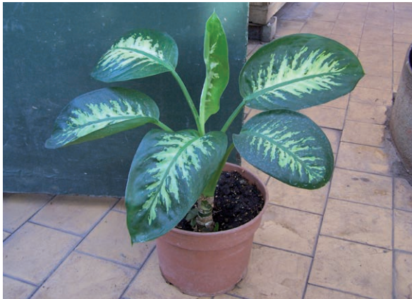
Rycina 5. Difenbachia Seguiny ( Dieffenbachia seguine ).