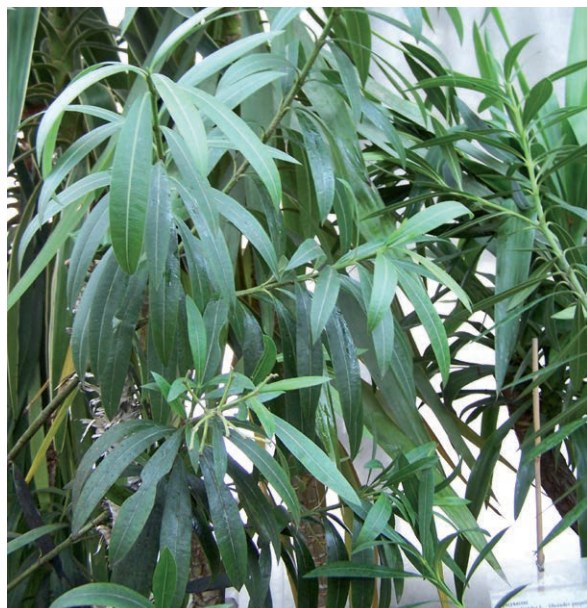
Rycina 9. Oleander pospolity ( Nerium oleander ).

Roślina pochodzi z rejonu Morza Śródziemnego. Jest krzewem wytwarzającym pachnące kwiaty barwy białej, różowej lub czerwonej (ryc. 9). Substancje toksyczne to działające nasercowo alkaloidy i glikozydy. Objawy zatrucia to: bóle głowy, mdłości, wymioty, biegunki, drgawki, narastające osłabienie serca, rozszerzenie źrenic i duszności. Po 2–3 h od spożycia trucizny może nastąpić śmierć [6, 7, 10, 12].