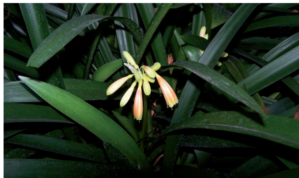
Rycina 2. Kliwia pomarańczowa ( Clivia miniata ).

Roślina wytwarza długie, wąskie liście i pomarańczowe kwiaty wyrastające w baldachu (ryc. 2). Trujące są wszystkie części rośliny, a szczególnie łodyga i nasady liści. Do objawów zatrucia należą: nudności, kaszel, ślinotok, wymioty, biegunka. Większe dawki mogą wywołać paraliż i zapaść [6, 7].