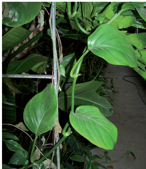
Rycina 10. Filodendron pnący ( Philodendron scandens ).

Objawy zatrucia: pieczenie w jamie ustnej, ślinotok, obrzęk warg, języka i krtani [10, 11].