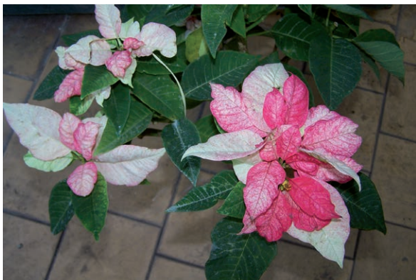
Rycina 6. Wilczomlec nadobny, poinsecja nadobna, gwiazda betlejemska ( Euphorbia pulcherrima ).

skórę, a pyłek kwiatowy może powodować uczulenie [6, 7, 10].