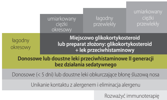
Rycina 6. Leczenie alergicznego nieżytu nosa według PoSLeNN (modyfikacja autorów).

i ponad 4 tygodnie) oraz w okresowym nieżycie nosa o umiarkowanym i ciężkim przebiegu podstawą leczenia powinny być donosowe glikokortykosteroidy. Glikokortykosteroidy donosowe z uwagi na powolne początkowe działanie nie są skuteczne w szybkim opanowaniu wszystkich objawów ANN, co może znacząco wpłynąć na współpracę z chorym i jego stosowanie się do zaleceń lekarskich. W związku z powyższym istnieje konieczność zaproponowania nowego podejścia do terapii PANN.