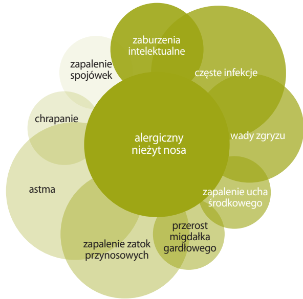
Rycina 5. Powikłania i choroby współistniejące z alergicznym nieżytem nosa według ARIA [4].

przyczynową metodą leczenia alergicznego nieżyty nosa jest swoista dla alergenu immunoterapia (u opisywanego chorego niestety nie była ona skuteczna). Leczenie schorzeń alergicznych powinno się rozpoczynać od próby eliminacji alergenu z otoczenia chorego lub przynajmniej zmniejszenia ekspozycji na alergen wywołujący objawy chorobowe [3].