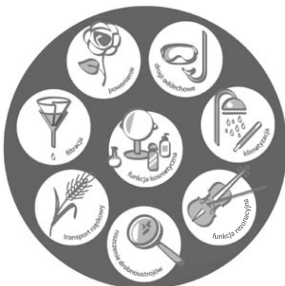
Rycina 3. Fizjologiczne funkcje nosa [2].