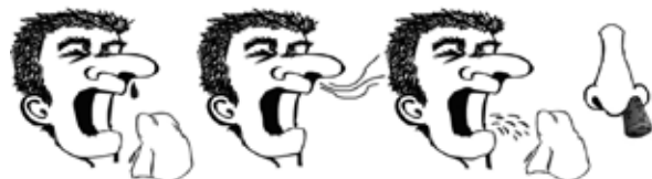
Rycina 1. Objawy alergicznego nieżyty nosa [2].

zaznaczone okresy dolegliwości chorobowych, a dobre efekty, jakie uzyskujemy przy zastosowaniu nowoczesnych donosowych leków steroidowych i przeciwhistaminowych, dodatkowo wzmacniają motywację chorych do podjęcia leczenia. W okresowym niezycie nosa nie ma też problemu z realizacją przez chorych recept. Koszty leczenia okresowego nieżyty nosa, z uwagi na konieczność zastosowania jedynie 1–2 opa-