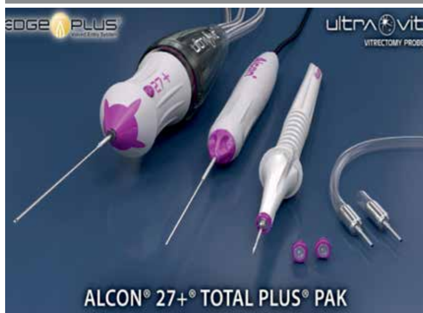
Narzędzia do witrektomii 27G.