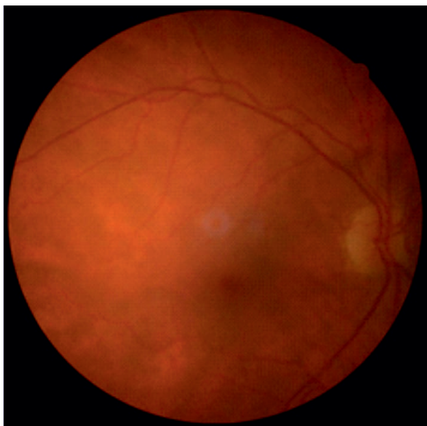
Fotografia barwna dna oka prawego nie wykazała obecności patologii siatkówki w zakresie do 45 stopni. Badanie to wykonywane jest rutynowo u każdego pacjenta, niezależnie od przyczyny wizyty.

Na podstawie powyższych badań postawiono diagnozę: przewlekła pooperacyjna hipotonia gałki ocznej związana z nadmierną filtracją pęcherzyka, narastająca nadwzroczność oraz astygmatyzm spowodowany rozrostem tkanki włóknisto-torbielowatej w obrębie spojówki oraz torebki Tenona w miejscu pęcherzyka filtracyjnego, zaćma niedojrzała lewego oka. Nadwzroczność małego stopnia oraz zaćma początkowa prawego oka.