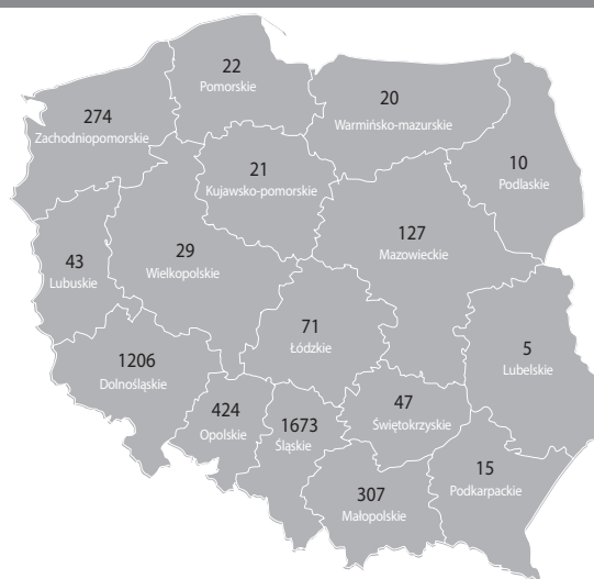
Liczba wniosków z poszczególnych województw, dla których Narodowy Fundusz Zdrowia wydał pozytywną decyzję o sfinansowaniu zabiegu usunięcia zaćmy poza granicami Polski (dane za 2015 r.).

Województwa: dolnośląskie, opolskie, śląskie, małopolskie – 73% świadczeń.